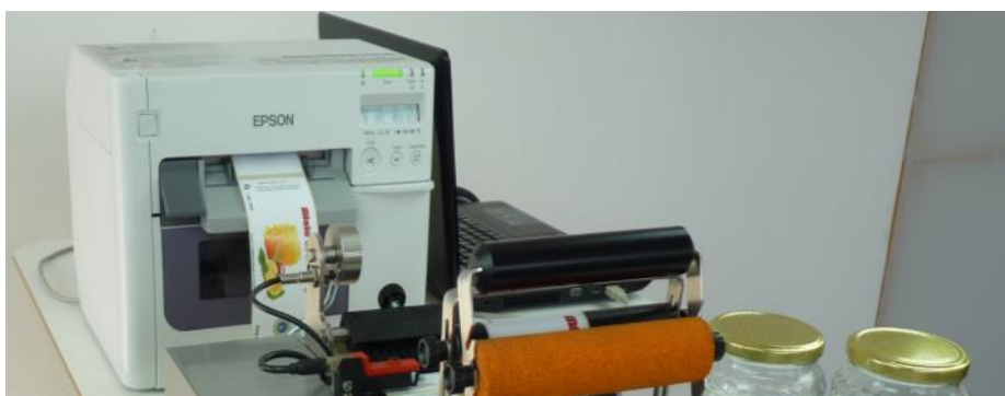
Pk-52 connesso a EPSON TM-C3500 stampa e applica etichette a colori con inchiostri resistenti a polimeri. Tutto in un solo passaggio, anche fronte/retro in piena autonomia.